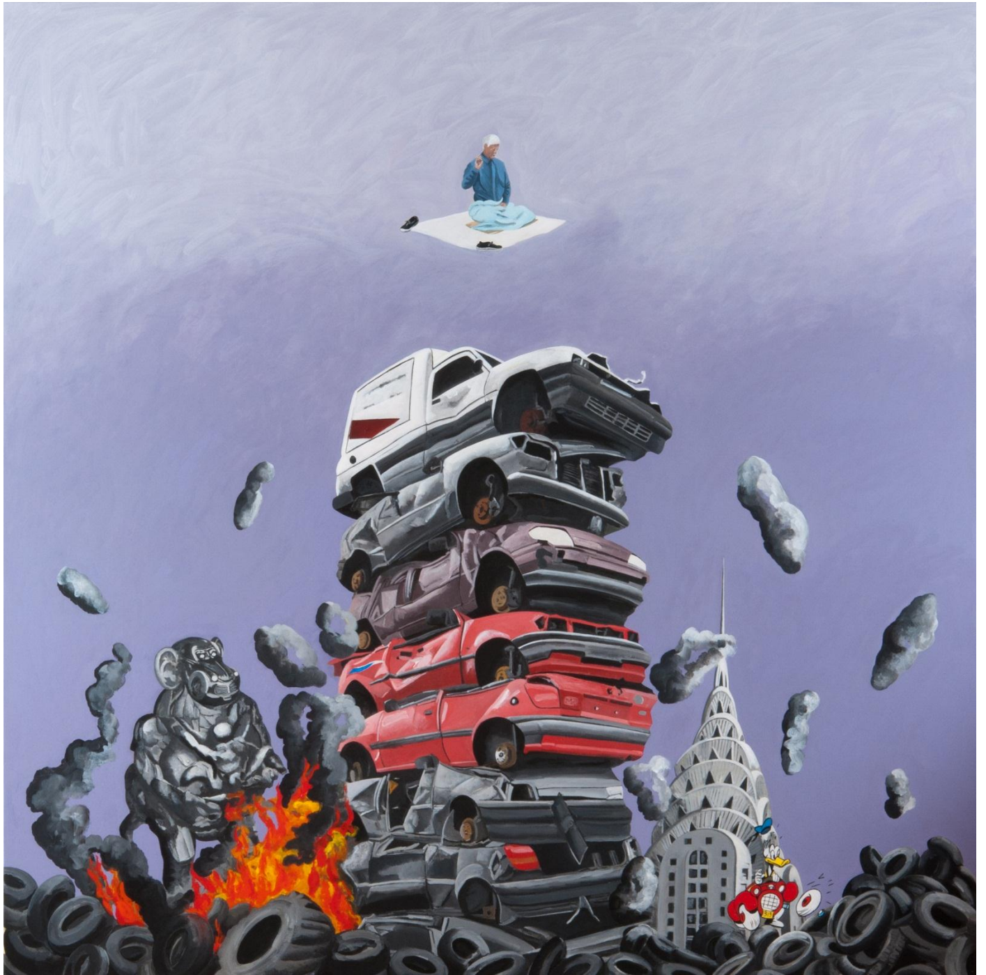
Catherine Lopes-Curval, La guenon de Picasso, 160x160, acrylique sur toile