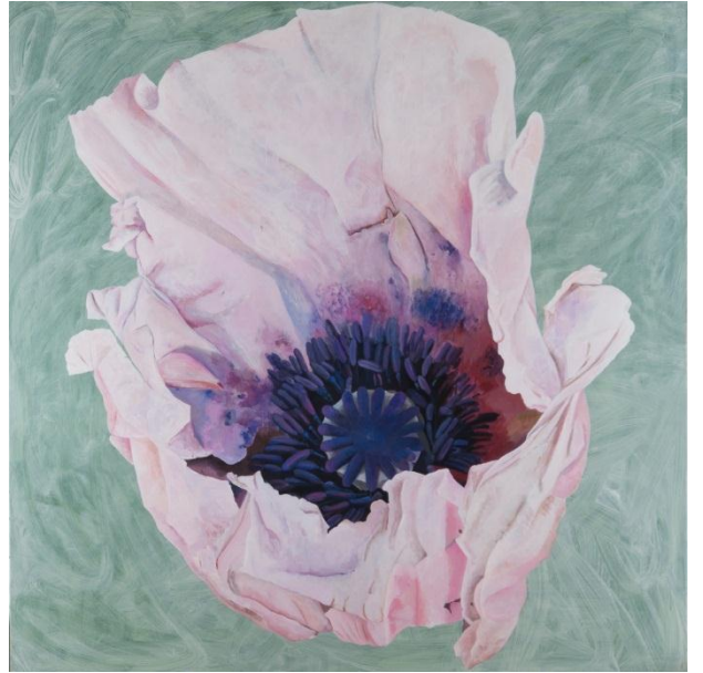
Rouge violet, 100x50, acrylique sur toile