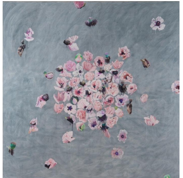
En vert et contre tout, 160x160, acrylique sur toile