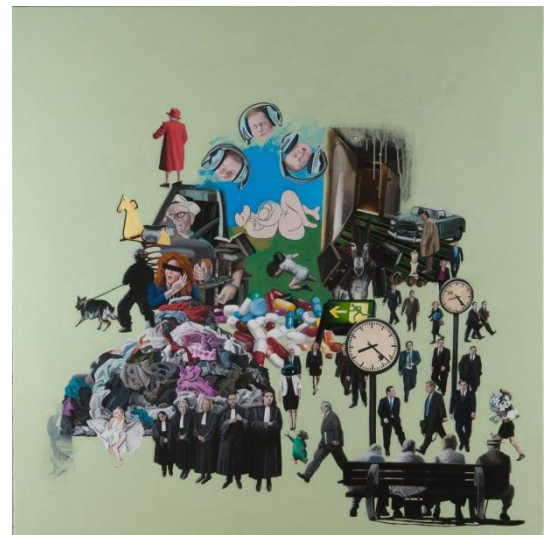
La guenon de Picasso, 160x160, acrylique sur toile