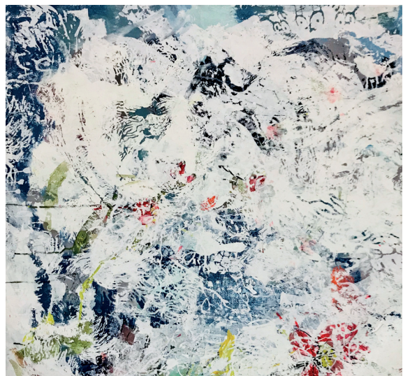
Longevity's garden #8 - 91x91cm