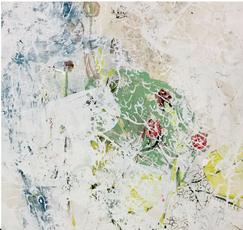
Longevity's garden #9 - 60x60cm